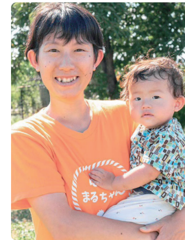
NPO法人 ゆめブロ (ほっとまるちゃん) 代表