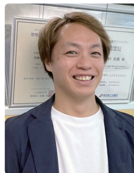
DiCE JAPAN株式会社 代表取締役