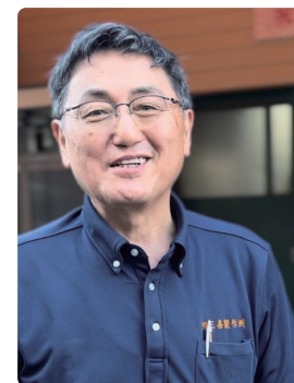
有限会社三喜製作所 代表取締役