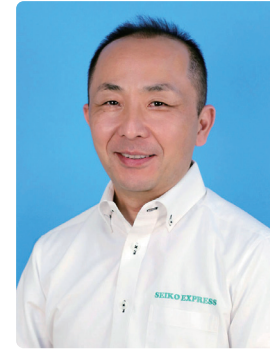
株式会社くらすむーぶ 代表取締役