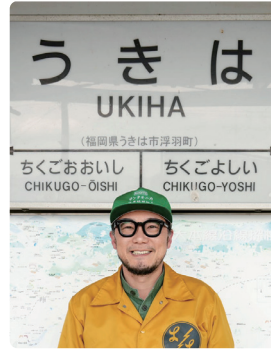
うきはの宝株式会社 代表取締役