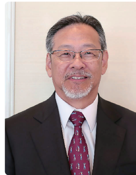
株式会社マルキチ 代表取締役社長